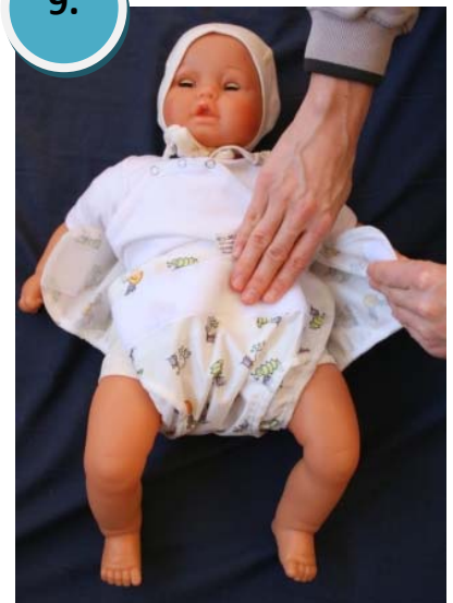
9.) Die Flügel der Überhose schließen.