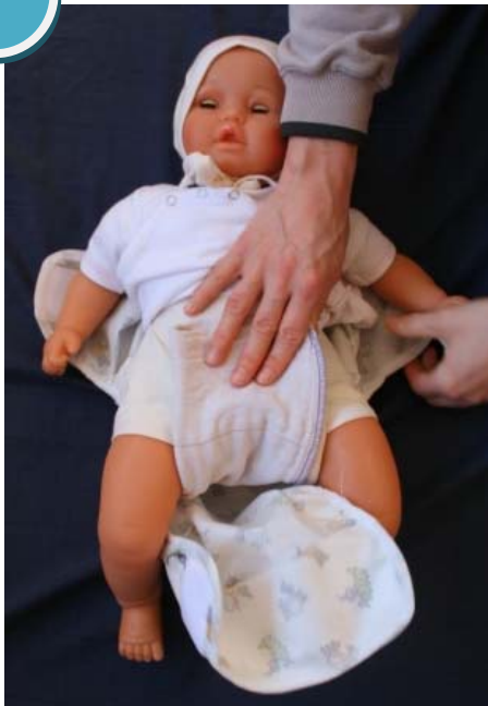
8.) Das Baby mit dem Po auf die Windel legen oder die Windel unter den Po des Kindes bringen und den vorderen Teil der Saugeinlage nach oben an das Kind anlegen.